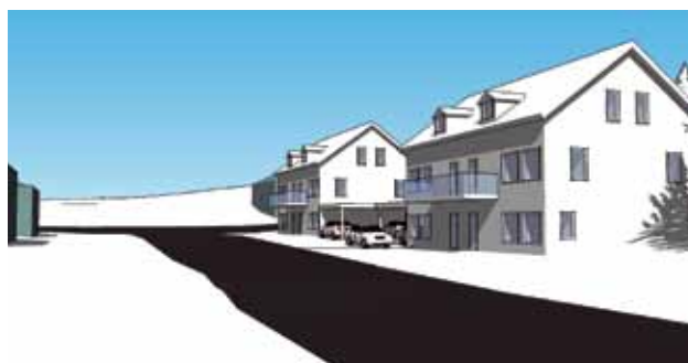
Skisser över tänkt ny bebyggelse. Illustrationer: White.