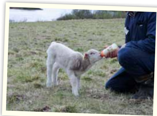
En fårbesättning köptes in och skapade arbetstillfällena i Kuttainen.

"Genom engagemang, kreativitet och samverkan mellan ideella krafter har man visat att det går att förändra livsvillkoren och göra det möjligt att skapa en gemenskap präglad av framtidstro"