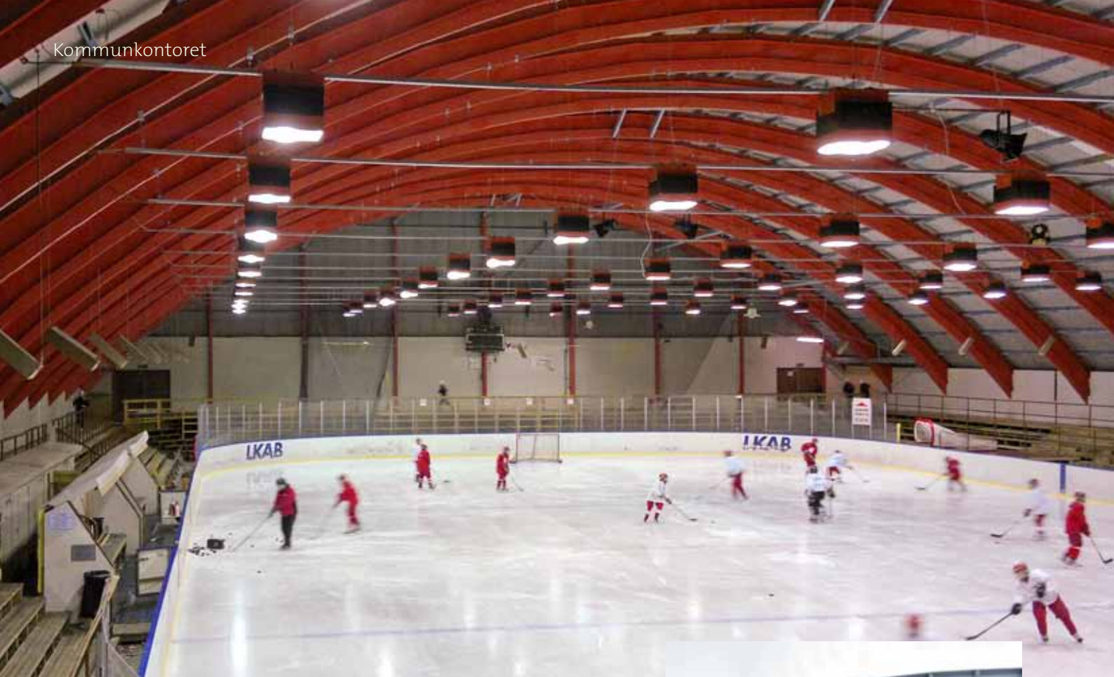
Kiruna IF Ungdom tränar i ishallen.