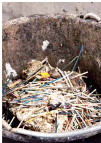
Tops och annat som inte hör hemma i avloppen och orsakar problem och driftsstörningar.