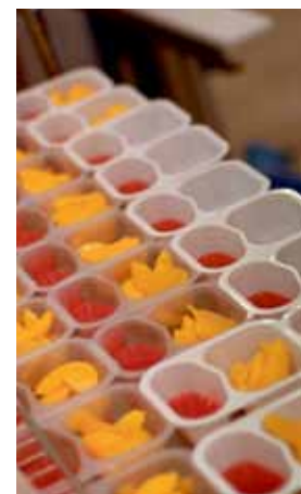
Persika med hallonsås – en färgkick på menyn.