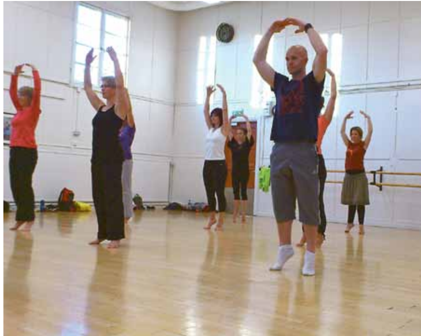
Vuxendans på Kulturskolan.