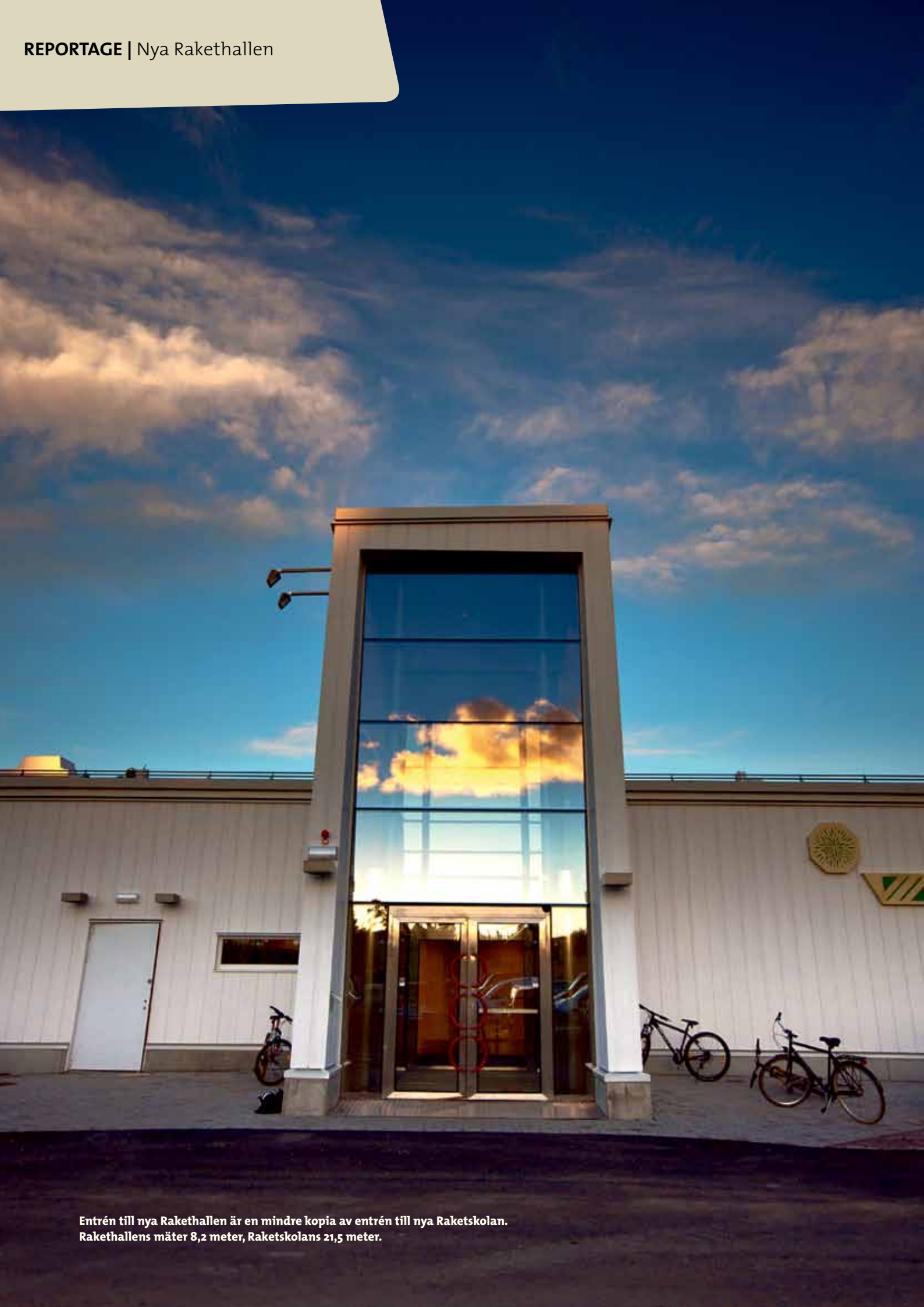
Entrén till nya Rakethallen är en mindre kopia av entrén till nya Raketskolan. Rakethallens måter 8,2 meter, Raketskolans 21,5 meter.

Nu är den klar – nya Rakethallen. En fullstor hall som framför allt ger mer plats för alla matcher, tävlingar och andra arrangemang i Kiruna. ”Det har varit fantastiskt att få vara med och bygga den här typen av byggnader som är arkitektoniskt mycket speciella”, säger Tommy Lidström, Kirunabostäder, som har varit projektledare för Rakethallen.