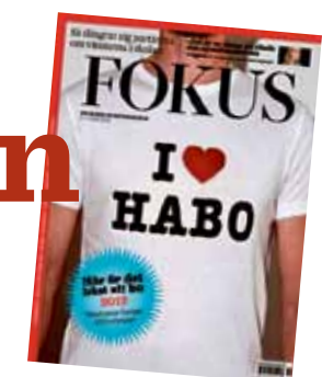
Nyhetstidningen Fokus rankar varje år Sveriges kommuner.

Kiruna kommun har egentligen oddsens emot sig i en sådan här ranking, för om man tittar på de kommuner som placerar sig i toppen av rankingen så är det de kommuner som ligger i närheten av en storstad. Vinnaren i 2012 års ranking, Habo, ligger till exempel inom pendlingsavstånd till Jönköping. Tvåan Knivsta ligger även den i närheten av en storstad, Uppsala. Så trots de långa avstånden vi har både inom kommunen och till närmsta storstad så placerar sig Kiruna ändå högt upp i rankingen tack vare mycket annat som är bra. ■