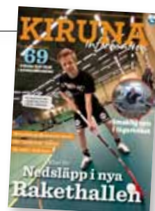
Omslagsbilden till Kiruna Information nr 3 | 2012

Varje år rankar nyhetstidningen Fokus Sveriges kommuner för att ta reda på var det är bäst att bo. Kiruna hamnar i år på en 63:e plats och klättrar hela 69 placeringar sedan förra årets ranking.