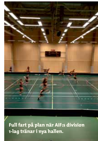
Full fart på plan när AIF:s division 1-lag tränar i nya hallen.

– Hallen har en enorm betydelse för föreningarna, speciellt när det gäller matchtider. Tidigare hade vi bara en fullstor hall >>