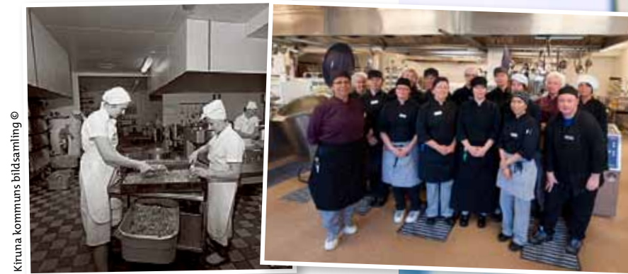
Personal vid kommunens centralkök på 60-talet respektive 2010-talet.

>> att tugga eller svälja. Hon poängterar dock att det är viktigt att hålla isär varmrättens olika delar, även om de alla har samma släta konsistens. – Vi äter ju även med ögonen. Man ska se att det är olika komponenter i måltiden även om alla har samma konsistens.