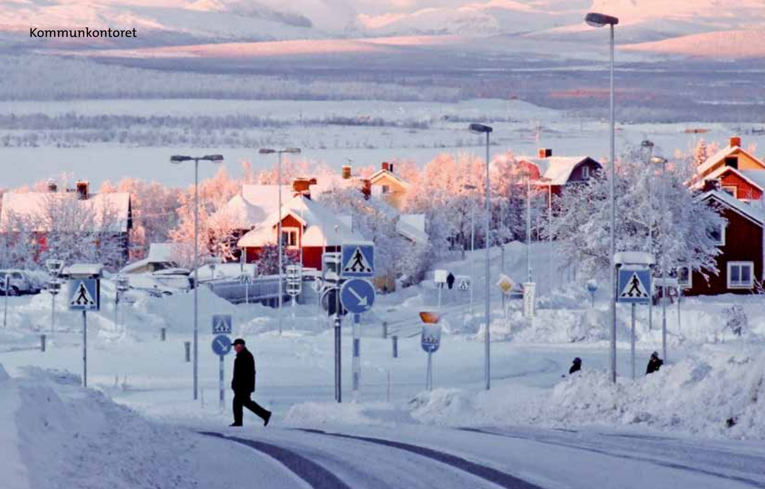
Plogade vägar och gångbanor för bra framkomlighet och säkerhet är A och O i en vinterstad som vår.