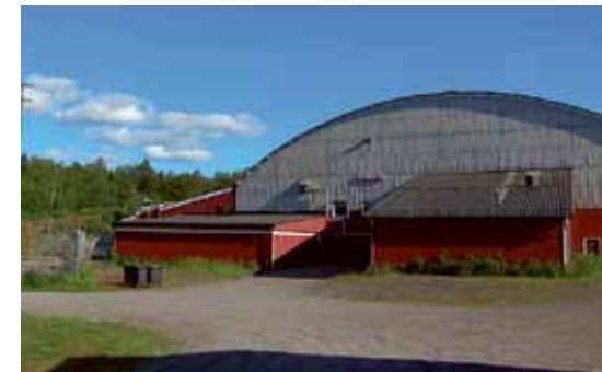
Klassiska Matojärvi ishall.

Lombia ishall har fräschats upp för cirka 1.3 miljoner kronor med nya stolar och nymålade golvytor, mediabås och räcken. Hela ishallen går nu i färgerna grått, svart och rött.