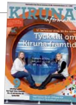
Omslagsbilden till Kiruna Information nr 1, 2013 är tagen på Nya Raketskolan av Jörgen Medman, Krauz&Co.

Produktion: Kiruna kommun i samarbete med Krauz&Co.