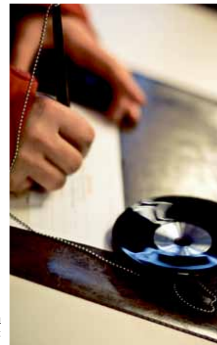
Väl fungerande offentlig och kommunal service, skapar inflyttning och gör att människor vill bo kvar i kommunen.

Hur ska det framtida välfärdssystemet se ut för att kommunmedborgarna och de som kan tänka sig att flytta till Kiruna kommun ska känna sig trygga och nöjda? Det har varit huvudfrågan för arbetsgruppen för offentlig service.