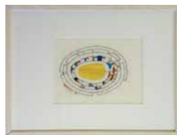
Möte kring ett runt samlingsbord av Britta Marakatt-Labba.