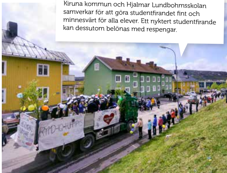
Kiruna kommun och Hjalmar Lundbohmsskolan samverkar för att göra studentfirandet fint och minnesvärt för alla elever. Ett nyktert studentfirande kan dessutom belönas med respengar.