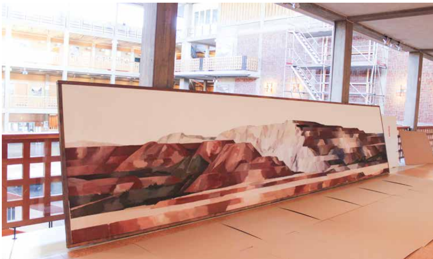
Sixten Lundbohms stora målning Kiirunavaara , drygt sju meter lång, monterades ned och paketerades varsamt in för vidare transport till konservatorn i Landskrona.

>> kommunen. Detta ledde bland annat till att Kiruna konstgille, LKAB, och Kiruna stad 1959 instiftade Kirunastipendiet. Det kom att bli ett av Sveriges mest eftertraktade konststipendium, inte i första hand för den ekonomiska delen, utan mer för vistelsen i Kiruna som ingår i stipendiet, samt konstinköp av konstnären i samband med dennes utställning.