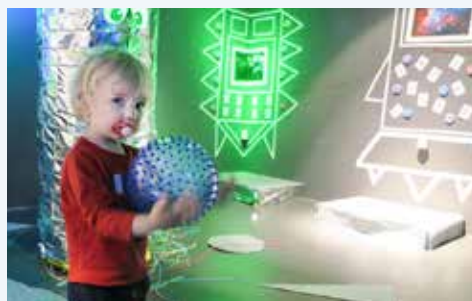
Här har barnen fått använda alla sina sinnen.

Rymdstationen har varit öppen under maj och vi har testat olika sätt att skapa dialog med föräldrarna om hur vi kan utveckla vår nya stadskärna på bästa sätt utifrån ett småbarns- och föräldraperspektiv. Vi har uppmanat föräldrarna att använda platsen så som de själva önskar och även