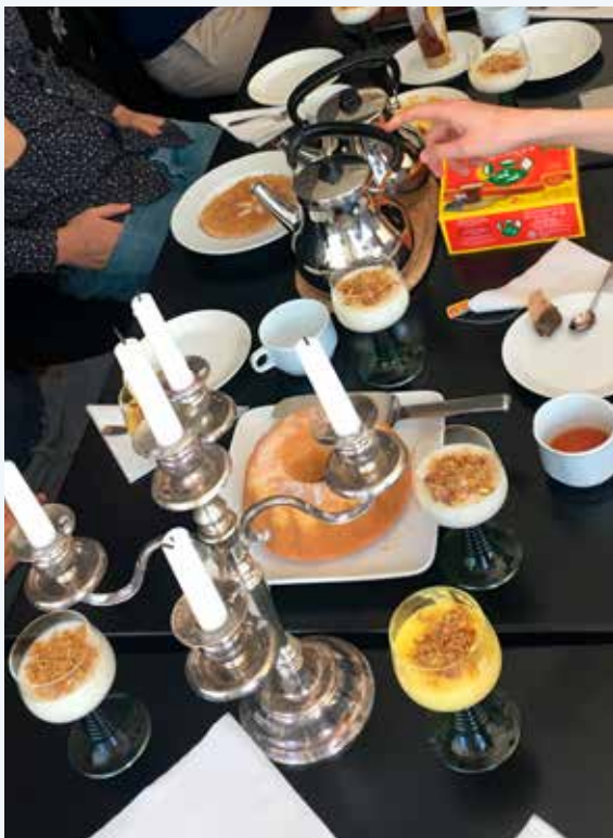
Smakrik dag då olika kulturer möttes i köket.