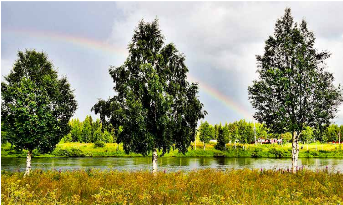
Lainio är en av de vackra byarna i kommunen. Här en vy över Erkinniva – byns medelpunkt. Lainio har fått sitt namn efter älven som delar denna gamla jordbruksby mitt itu.