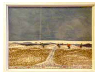
Fiskare av Britta Marakatt-Labba.