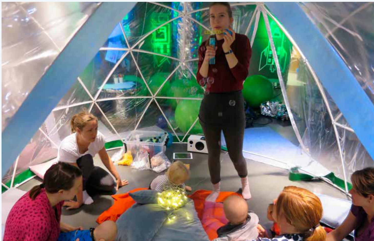
Rymdstationen i Gallerian har varit välbesökt av både stora och små.

Under de följande veckorna klurade vi på lokaler som lämpade sig för att testa hur en lekfull mötesplats kunde se ut för att bäst möta behovet från föräldralediga i Kiruna. Tack vare LKAB och KBAB kunde vi flytta in i Gallerian – en perfekt plats för vårt uppdrag.