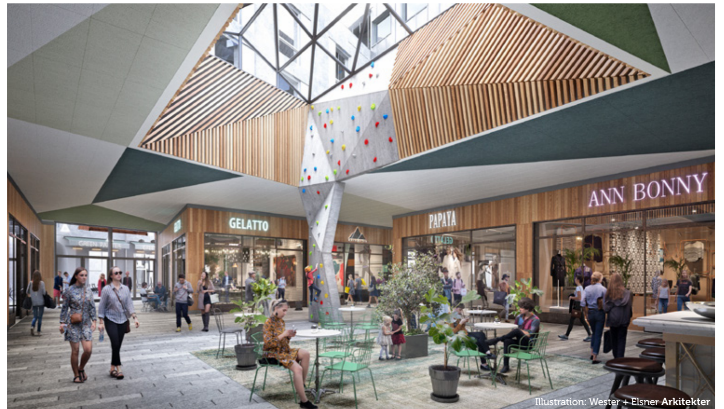
Illustration: Wester + Elsner Arkitekter

MARK- OCH INFRASTRUKTURARBETEN Vatten, avlopp, fiber, fjärrvärme, gator, sanering, dagvatten, stadspark med mera Nuläge: Anläggning pågår Budget: 400-500 miljoner till och med 2024 Hittills investerat: 260 miljoner