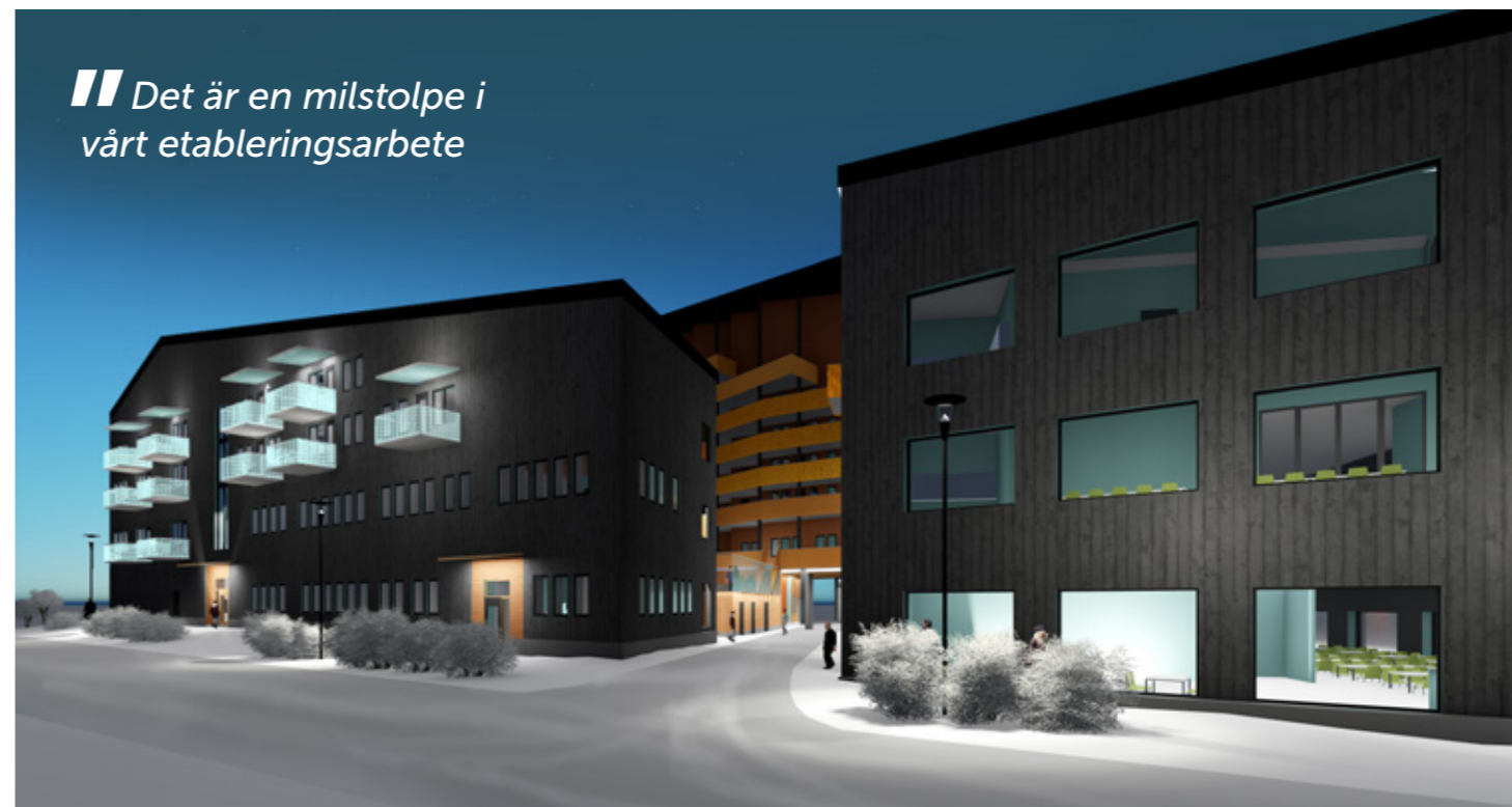
Kirunabostädernas kvarter 1 vid Malmvägen. Illustration: Arkitekthuset Monarken

“Det är en milstolpe i vårt etableringsarbete