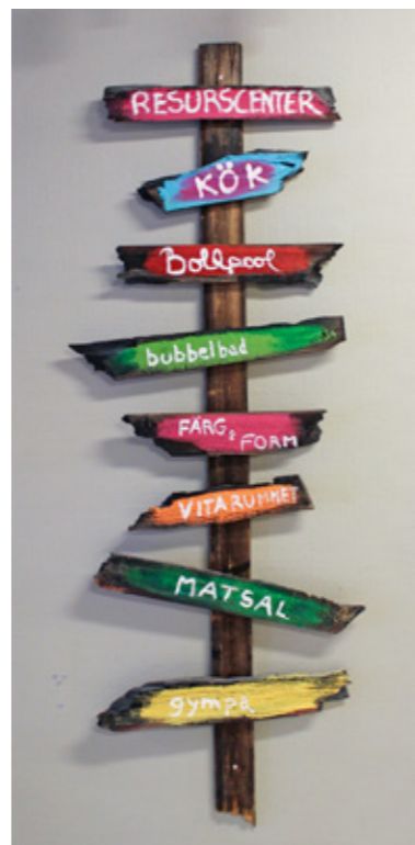
Efter gymnasiet kan personer med funktionsvariationer erbjudas att bli arbetstagare på Resurscenter. Här fortsätter de sedan att träna på att läsa, skriva och arbeta med datorer. De som inte kan använda penna eller datorer kan till exempel använda symboler.