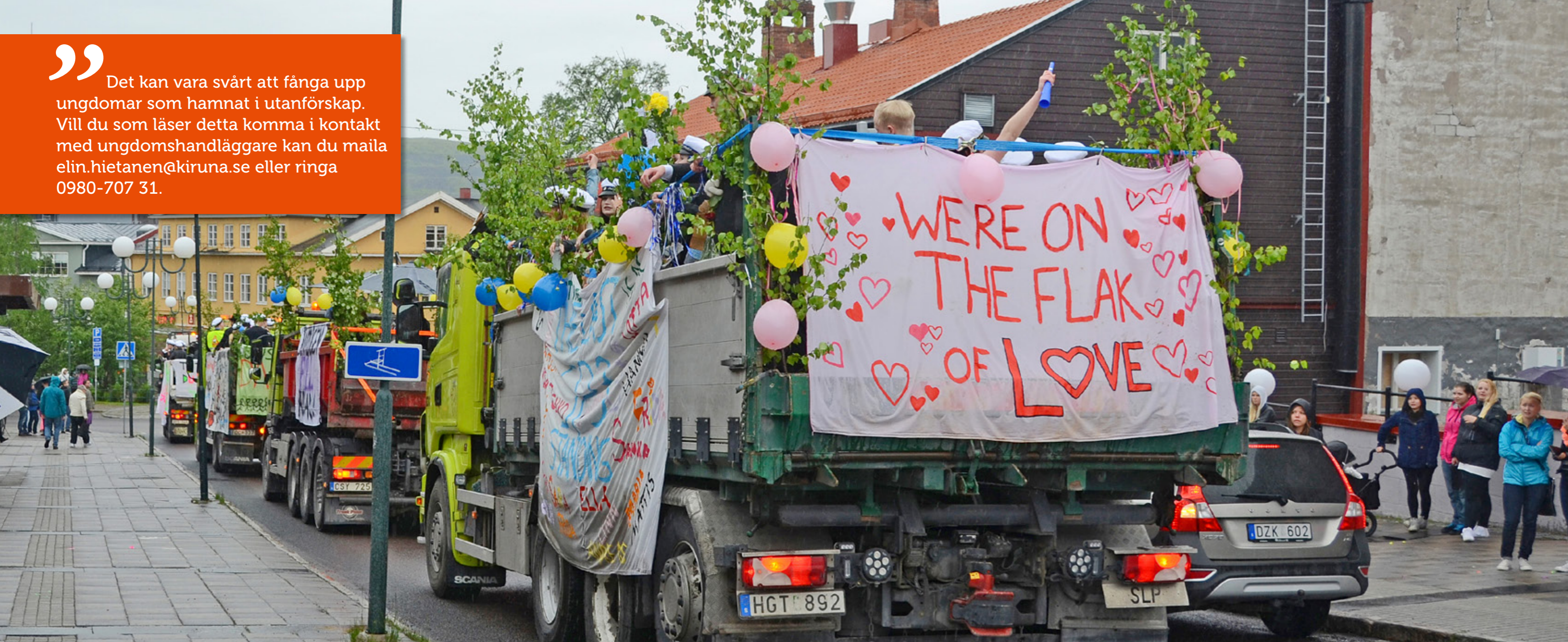
Kiruna kommun vill att fler gymnasieelever ska klara av att ta examen. Därför jobbar kommunen med en bred samverkan mellan flera aktörer.

Det kan vara svårt att fånga upp ungdomar som hamnat i utanförskap. Vill du som läser detta komma i kontakt med ungdomshandläggare kan du maila elin.hietanen@kiruna.se eller ringa 0980-707 31.