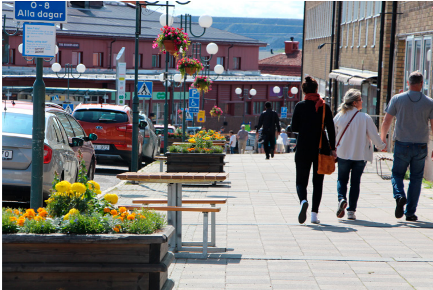
Vissa känner sig otrygga i delar av centrala Kiruna.