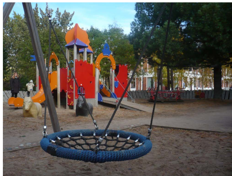
Exempel på områdeslekplats

Alla lekplatser måste rustas upp emellanåt. En välskött och städad lekplats visar att barn och deras behov är prioriterade.