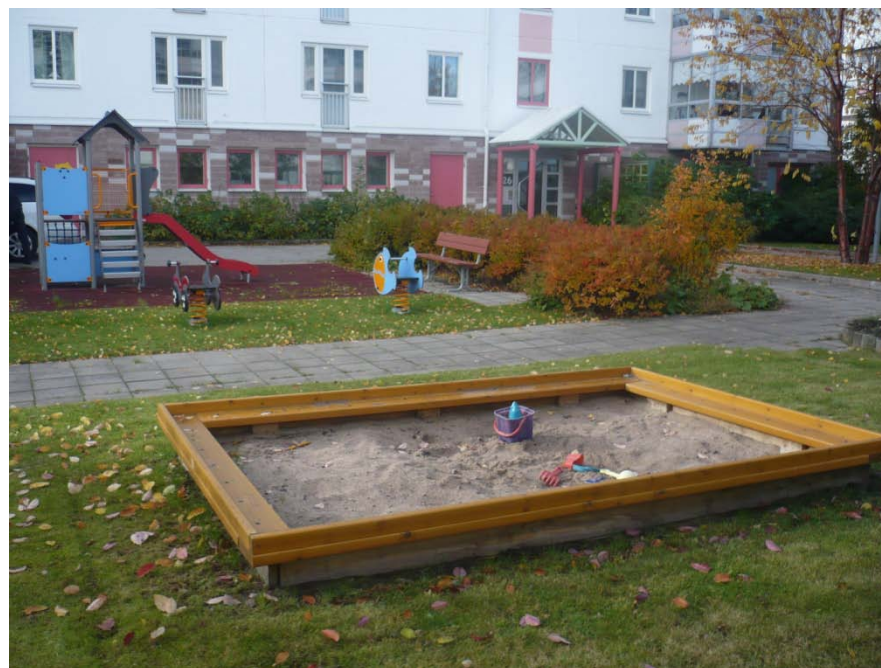
Exempel på närlekplats

Alla lekplatser måste rustas upp emellanåt. En välskött och städad lekplats visar att barn och deras behov är prioriterade.