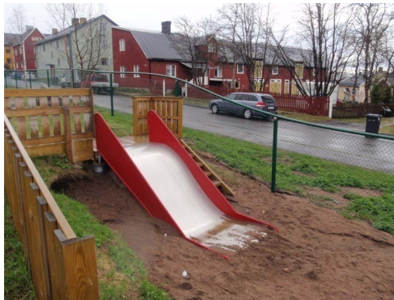
Lokeldarens förskola, Tågmästaregatan

I barntäta områden behövs en närlekplats med lekredskap för de mindre barnen där de kan gunga, gräva och rutscha. Ett litet lekhus kan locka till rollspel. Små barn vill ofta känna närhet till en vuxen, för att fullt ut kunna hänga sig åt leken. Det är därför viktigt att det finns sittplatser i direkt anslutning till lekplatsen, gärna modell fika-