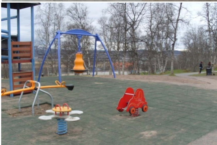
Järnvägsparken, Kiruna centrum