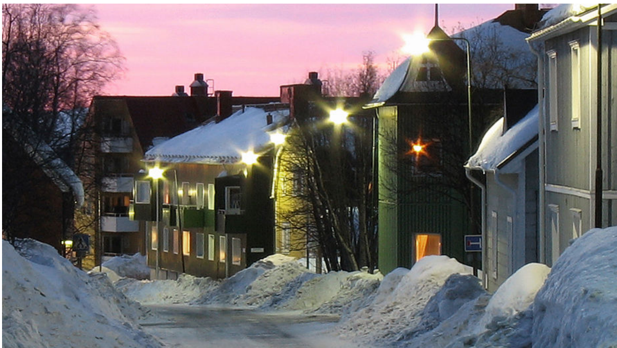
Bild 1. Reenstiernagatan, Kiruna C

Under rubriken "Vi lämnar följande kvalitetsdeklaration" ser du när snöröjningsarbetena startar och hur länge de får ta. Med kvalitetsdeklarationen vill vi att allmänheten ska veta vilka vägar, gång- och cykelvägar som är framkomliga och när.