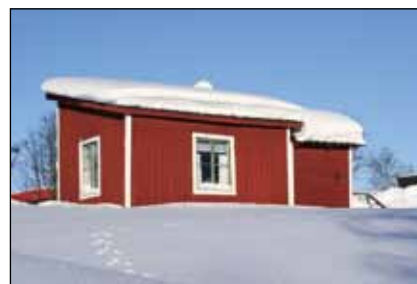
Kirunas äldsta bostadshus, som i dag ligger vid Församlingshemmet, tillhör också det utvidgade gruvstadsparkområdet och ska flyttas.