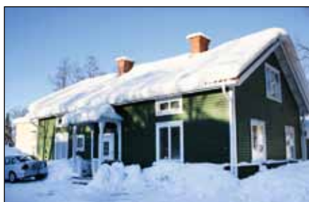
B5:an, som stod klar 1899, ligger vid kvarteret Ullspiran och ska flyttas.