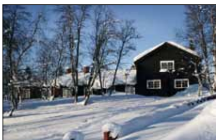
Hjalmar Lundbohmgården inklusive B1:an ska flyttas.

Kiruna kommun och LKAB är överens om att byggnaderna på bild nedan ska flyttas. Kyrkan med tillhörande klockstapel samt Kirunas äldsta bevarade bostadshus, står i dag inte inom Gruvstadsparken men räknas in i ett utvidgat gruvstadsparkområde och finns därför med i avtalen. Det gör även de tolv så kallade Bläckhorn som i dag finns inom kvarteret Fjällsippan och kvarteret Fjällbruden och som man också avser att flytta från det utvidgade gruvstadsparkområdet.