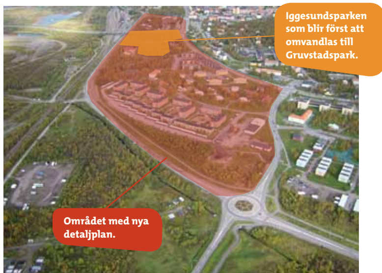
Detaljplanens område består i väster av gruvområdet, i norr av järnvägsparken, i öster av Hjalmar Lundbohmsvägen och Silfwerbrandsgatan. Gruvstadsparkens första etapp anläggs i Iggesundsparken.

Andra viktiga miljökonsekvenser är påverkan på Yli Lombolo och Ala Lombolo då deformationerna kommer att leda till att vattentillförseln till dessa sjöar minskar. Miljökonsekvenserna för Ala Lombolo mildras genom att planen gör det möjligt att anlägga en dagvattenbäck. Påverkan på Ala Lombolo avgörs inte i denna miljökonsekvensbeskrivning utan i miljöprovningen för ändrad avbördning och ny damm för Luossajärvi.