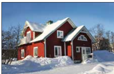
B5:an, ett Svedbergshus, byggt 1901, som ligger på Bromsgatan 19, i det utvidgade gruvstadsparkområdet, ska flyttas.