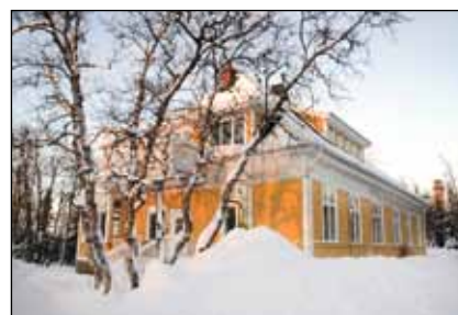
Ingenjörsbostaden, B39, som ligger mellan Stadshuset och Hjalmar Lundbohmgården ska flyttas.