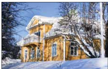
Länsmansbostaden, B99, byggt 1906, som ligger mellan Stadshuset och Järnvägsstationen ska flyttas.