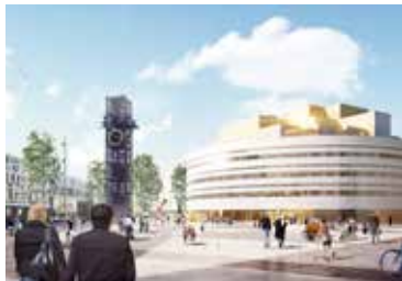
Illustration: Henning Larsen Architects A/S

Det är själva byggnadskonstruktionen med kristallen i mitten, men även byggnadens anpassning till verksamheterna som gjort att förberedelsearbe-